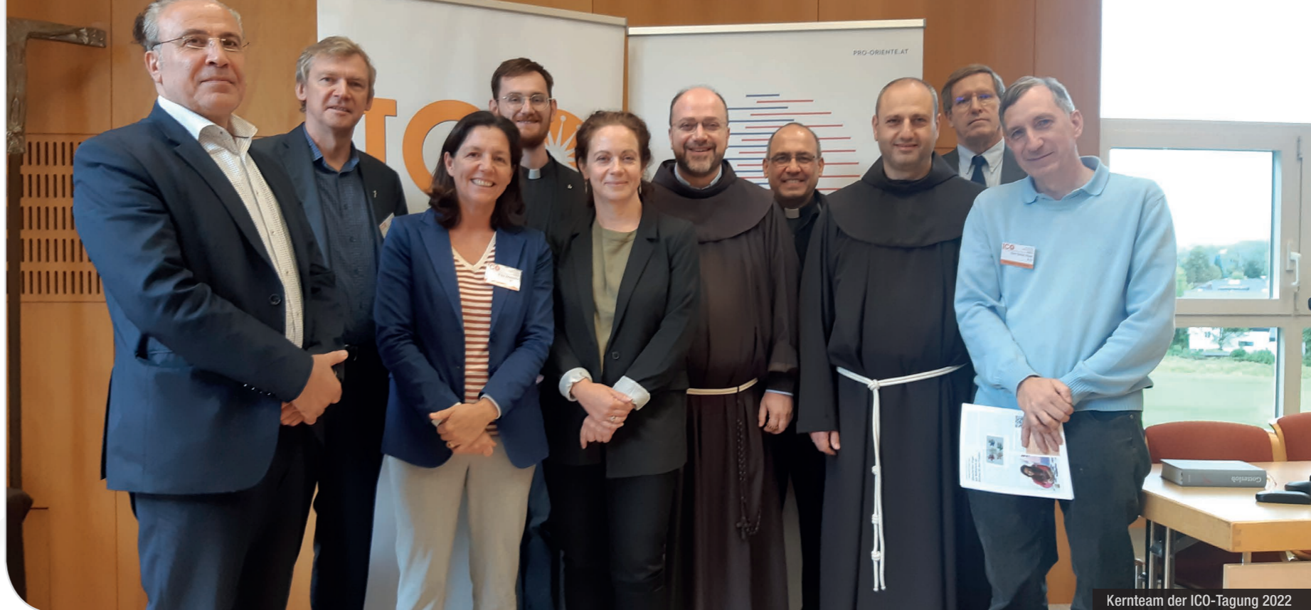
Kernteam der ICO-Tagung 2022