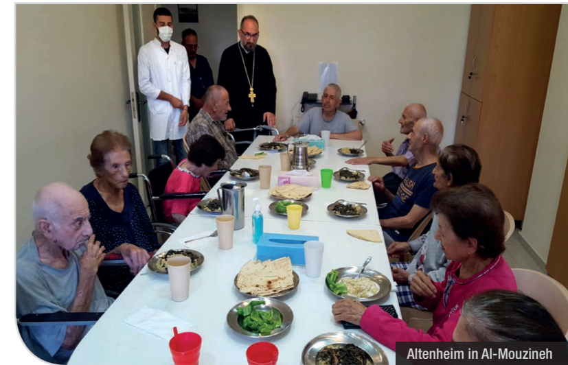
Altenheim in Al-Mouzineh