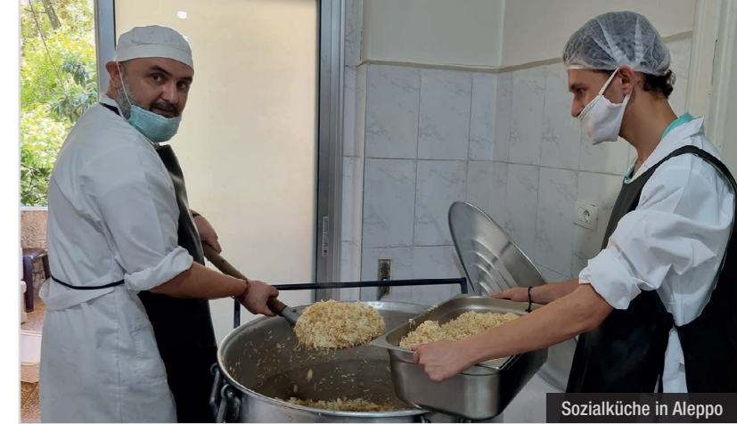
Sozialküche in Aleppo

Erstmalig wurden 2022 auch zwei Projekte der griechisch-orthodoxen Pfarre Al-Mouzineh in der Region „Wadi al-Nasara“ („Tal der Christen“) gefördert, und zwar die Verpflegung der Bewohnerinnen und Bewohner des lokalen Altenheims der Pfarre sowie ein Projekt zur Einkleidung von Kindern mit warmer Winterbekleidung im Rahmen der ICO-Winternothilfe.