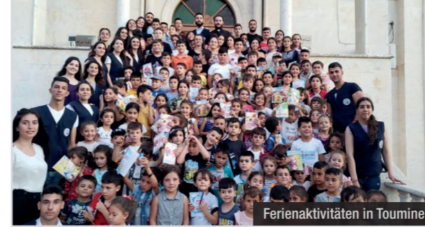
Ferienaktivitäten in Toumine

Ein wichtiger Schwerpunkt der ICO-Arbeit in Syrien ist schon seit längerem die Metropole Aleppo im Norden des Landes, jene Stadt also, die jahrelang heftig zwischen Rebellen und Regierungstruppen umkämpft war und deren Bevölkerung besonders schwer unter den Ereignissen gelitten hat. Der Hauptpartner vor Ort war auch 2022 die vom Orden der Franziskaner geleitete katholische Pfarre St. Franziskus, die durch zahlreiche Projekte dabei unterstützt wurde, den Menschen in der leidgeprüften Stadt wirksam zu helfen: Es begann mit einer Muttertagsaktion, in deren Rahmen mehr als 800 Mütter einen kleinen Betrag in bar zur eigenen Verwendung erhielten. Unterstützt wurde auch wieder die bereits im Vorjahr mit Hilfe der ICO gegründete Sozialküche der Pfarre, die inzwischen eine besondere Bedeutung für die Menschen in der Stadt gewonnen hat. Dank einer mehrjährigen Förderung durch die RD-Foundation Vienna konnte wiederum ein Programm für schulischen Nachhilfeunterricht für Kinder und Jugendliche ermöglicht werden. Während der Sommerferien ermöglichte die ICO ein sechswöchiges Ferienprogramm der Pfarre, an dem ca. 1.000 Kinder und Jugendliche aller christlicher Konfessionen der Stadt teilnahmen, und zu dessen Abschluss 556 Kinder mit Schulrucksäcken und Schulmaterial für das neue Schuljahr ausgestattet wurden