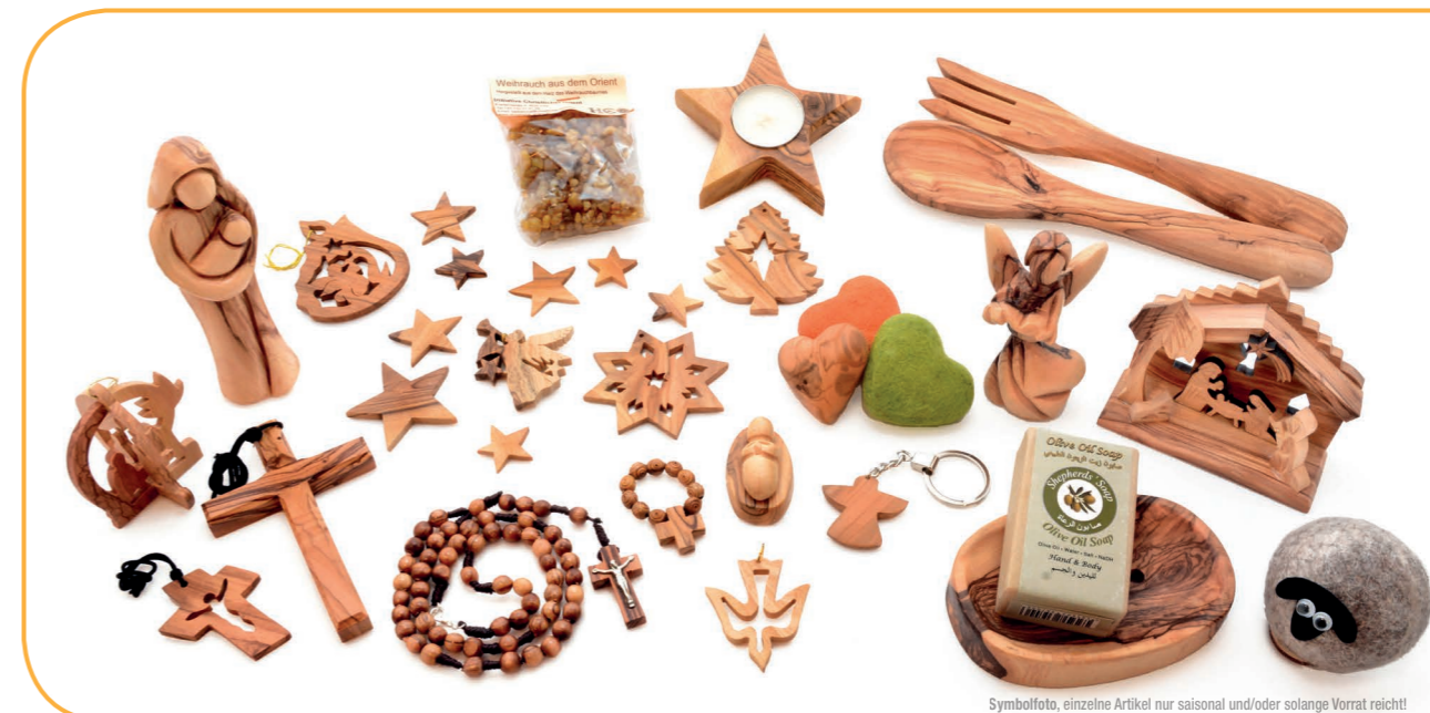
Symbofoto, einzelne Artikel nur saisonal und/oder solange Vorrat reicht!