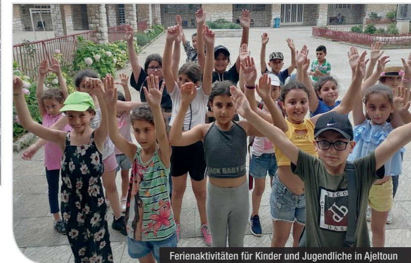
Ferienaktivitäten für Kinder und Jugendliche in Ajeltoun

aus zwei Salzburger Pfarren unterstützt, u.a. auch mit Fördermitteln der Salzburger Landesregierung über den Entwicklungspolitischen Beirat.