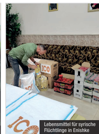
Lebensmittel für syrische Flüchtlinge in Enishke