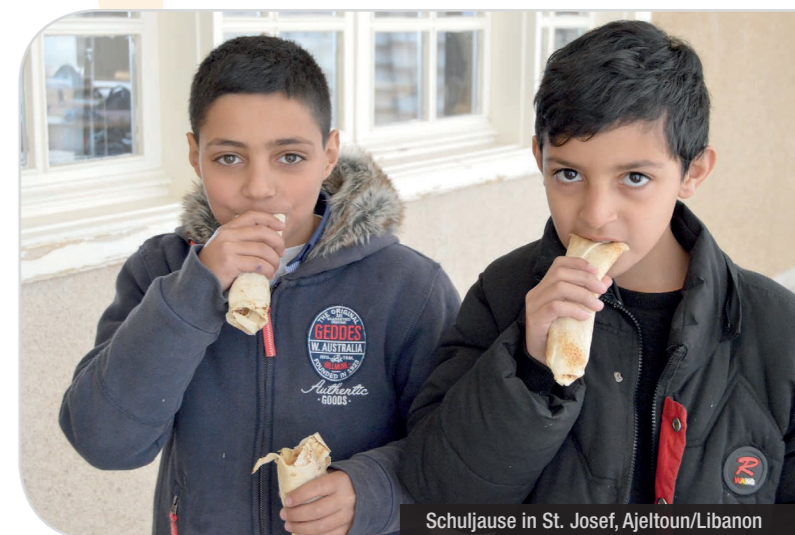
Schuljause in St. Josef, Ajeltoun/Libanon

Von unveränderter Bedeutung für die Ernährungssicherung zahlreicher Bedürftiger war die Unterstützung zweier Suppenküchen sowie eines Bäckereiprojekts durch die ICO. Die Ende 2021 begonnene Finanzierung der Sozialküche der Ordensgemeinschaft der Lazaristen im Beiruter Stadtteil Achrafieh musste nach der Ausgabe von mehr als 14.000 warmen Mahlzeiten an ca. 500 regelmäßige Bezieher bis Ende Mai 2022 leider eingestellt werden. Die Unterstützung der ICO (im Jahr 2022 insgesamt 30.000 EUR) war von Beginn an nur als Übergangsförderung bis zur Übernahme und Weiterführung durch ein anderes Hilfswerk geplant gewesen – der Beginn des Krieges in der Ukraine sorgte jedoch für eine Verschiebung der Prioritäten, weshalb leider kein anderer Partner gefunden werden konnte und die moderne Großküche der Lazaristen in der Folge leider stillgelegt werden musste. Fortgesetzt wurde jedoch ein Bäckerei-Projekt mit den Lazaristen, für das die ICO einen Betrag von 52.000 EUR zur Verfügung stellte. In einer kleinen Bäckerei, die vom Sozialbüro der Lazaristen in einem Beiruter