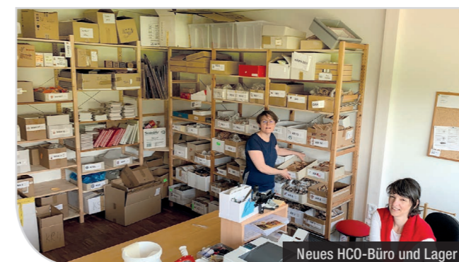
Neues HCO-Büro und Lager

Im neuen Büro in der Fröbelstraße können wir erstmals alle Waren übersichtlich in einem Zimmer lagern, was die Arbeit deutlich vereinfacht.