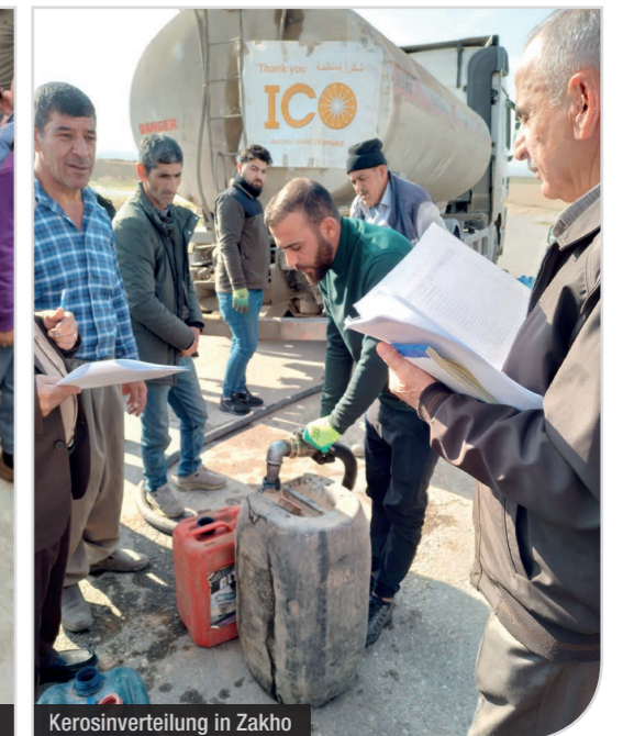
Kerosinverteilung in Zakho