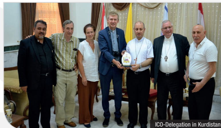
ICO-Delegation in Kurdistan