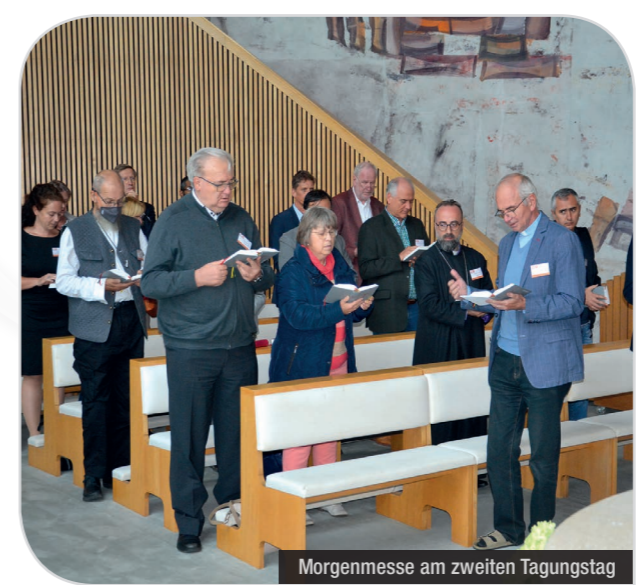
Morgenmesse am zweiten Tagungstag