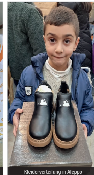
Kleiderverteilung in Aleppo