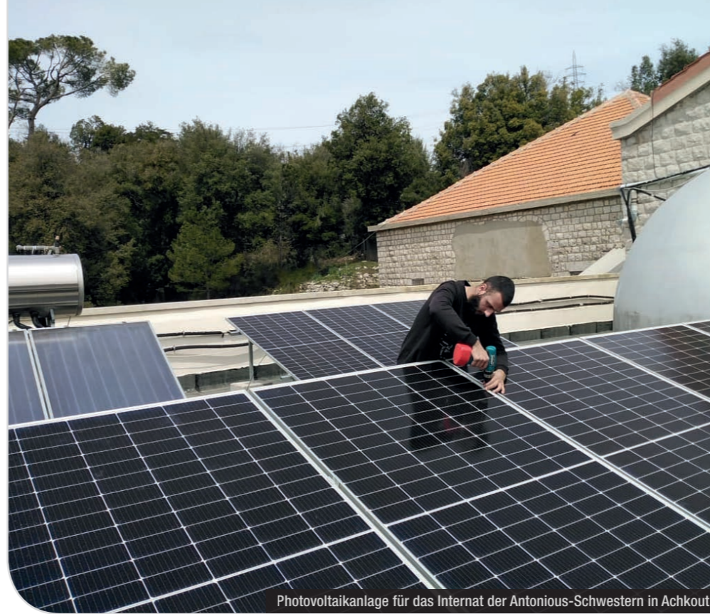
Photovoltaikanlage für das Internat der Antonius-Schwwestern in Achkout

Die Hilfe der ICO im Libanon konzentrierte sich bislang traditionell auf den Bildungsbereich. Aufgrund der katastrophalen Lage im Land gewann jedoch auch der Bereich der Nahrungsmittelhilfe im Laufe des Jahres 2022 eine immer größere Bedeutung (Unterstützung von zwei Suppenküchen sowie eines Bäckerei-Projektes). Aufgrund der massiven Energiekrise, die das Land fest im Griff hat, wurden außerdem zwei Einrichtungen (die Schule St. Franziskus von Assisi in der Ortschaft Menjez, ganz im Norden des Landes, sowie ein Internat der maronitischen Antonius-Schwwestern in der Ortschaft Achkout im Libanongebirge) bei der Errichtung von Photovoltaik-Anlagen unterstützt. Der Schwerpunkt der Unterstützung im Bildungsbereich galt nach wie vor diversen Ordensschulen sozial aktiver Ordensgemeinschaften (Barmherzige Schwestern, Schwestern von Besançon, Schwestern vom Guten Hirten sowie Karmeliten) in verschiedenen Regionen des Landes. Die größte Vielfalt von Projekten wurde in der Schule St. Josef der Barmherzigen Schwestern in Ajeltoun umgesetzt: Hilfe im Rahmen der Schulgeld-Aktion, Schuljause, Schulausspeisung für besonders bedürftige Kinder, Sommer-Ferienlager, Winternothilfe. Zwei der Schulen (darunter auch die Schule St. Josef) werden dankenswerterweise von zwei recht aktiven Solidaritätsgruppen