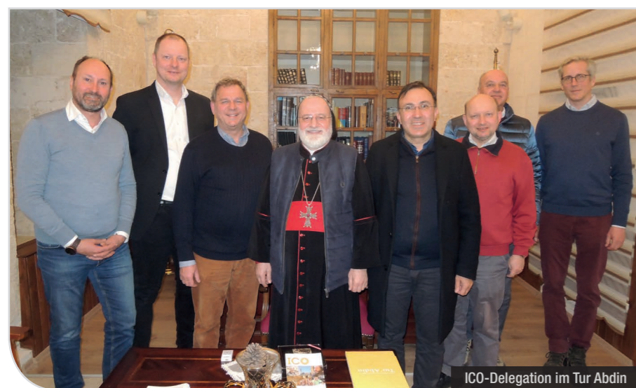
ICO-Delegation im Tur Abdin