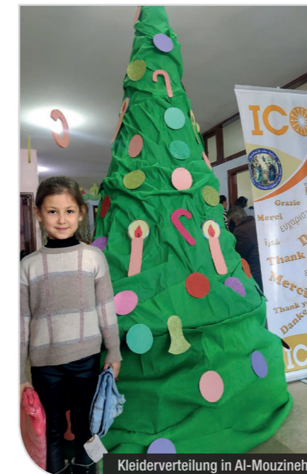
Kleiderverteilung in Al-Mouzineh

Insgesamt wurden im Jahr 2022 somit 11 Projekte im Rahmen der Winternothilfe mit einem Gesamtbetrag von 190.343 Euro finanziert.