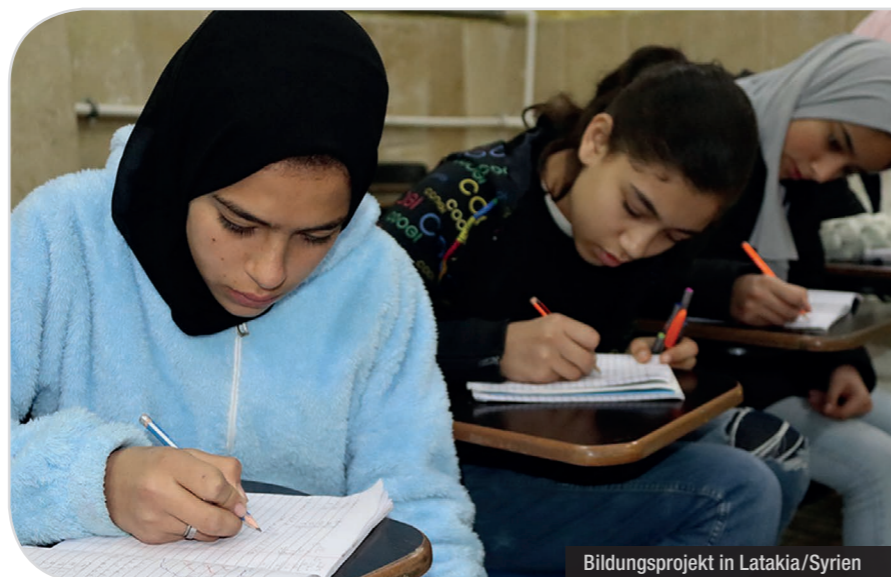
Bildungsprojekt in Latakia/Syrien

In Syrien wurde die Renovierung einer Behindertenschule der griechisch-katholischen Kirche in der Hauptstadt Damaskus mit 10.000 EUR unterstützt. In der röm.-kath. Pfarre St. Fran-