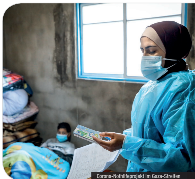
Corona-Nothilfeprojekt im Gaza-Streifen