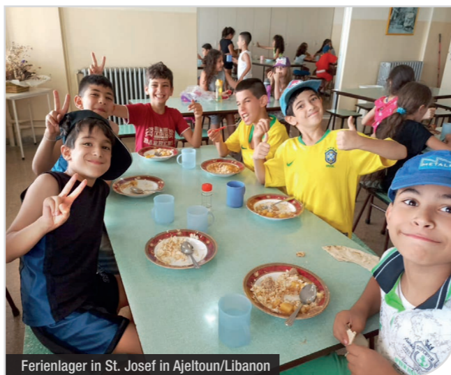
Ferienlager in St. Josef in Ajeltoun/Libanon

Insgesamt wurden im Sommer 2022 also drei Projekte für Ferienlager bzw. Sommeraktivitäten mit 46.500 Euro von der ICO unterstützt.