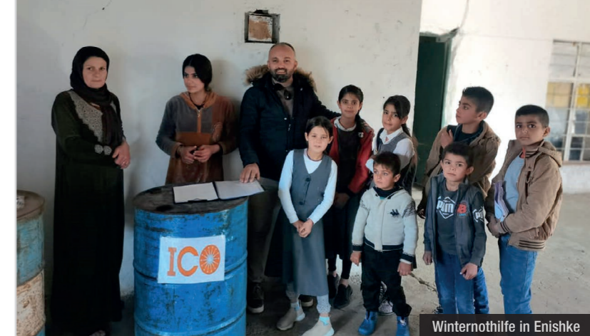
Winternothilfe in Enishke

Ein weiterer bewährter Partner im Land ist die lokale NGO CAPNI (Christian Aid Program – Nohadra – Irak), eine Organisation der assyrischen Kirche. CAPNI wurde 2022 von der ICO bei zwei Projekten in der nordirakischen Nive-Ebene unterstützt. Diese war lange Zeit das Hauptsiedlungsgebiet der Christen in der Region, bis ab 2014 durch das Vordringen des IS eine Massenflucht ausgelöst wurde und viele der Dörfer zerstört wurden. In Bartilla konnte CAPNI mit Mitteln der ICO Rückkehrer durch ein Aus- und Fortbildungsprojekt (insg. 32 Personen nahmen an drei verschiedenen Kursen teil) unterstützen, während für ein Projekt mit verschiedenen Komponenten zugunsten von Rückkehrern nach Batnaya zu Jahresende die Mittel zwar noch überwiesen wurden, die Umsetzung jedoch erst 2023 erfolgen wird.