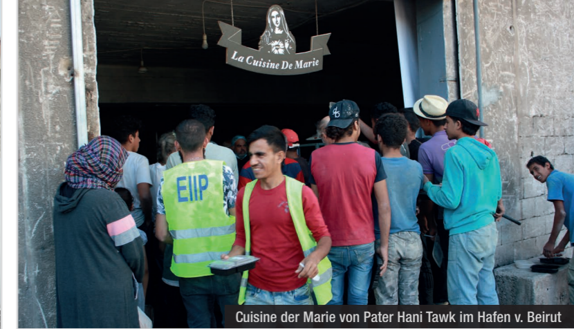
Cuisine der Marie von Pater Hani Tawk im Hafen v. Beirut