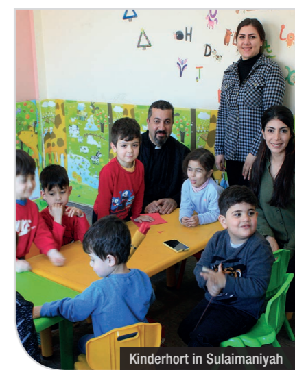
Kinderhort in Sulaimaniyah